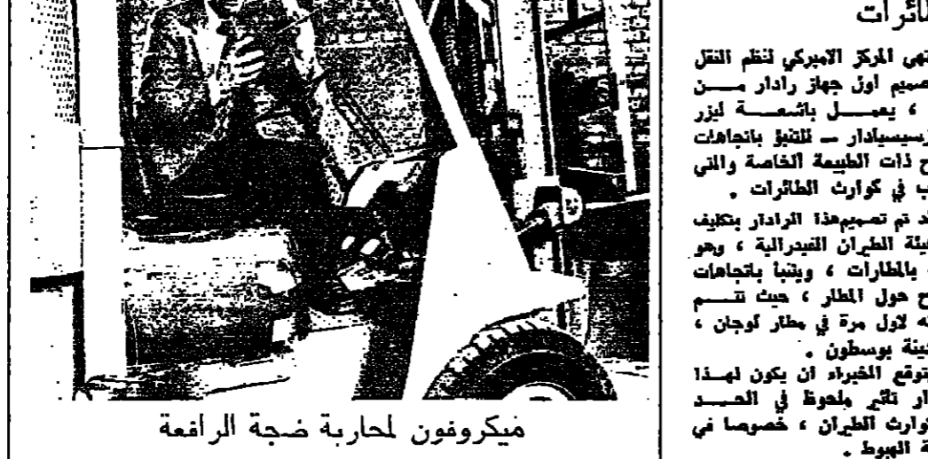
ميكروفون لمحاربة ضجة الرافعة يقوم علماء بريطانيون بإجراء اختبارات مخفية من اجل توليد الضجة المتخفية عن محرك رافعة بريطانية تدور على اساق الرافعة. لقد تم تثبيت «ميكروفون» دقيق تحت كرسى السائق لتسجيل درجة الصوت والعمل على تخفيفه.

العلماء ينجحون في توليد المغناطيس الاقوى